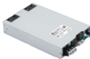
Medical / Industrial AC-DC Power Supply 1200W with 5V/2A Standby /MEB 1K2

Novità, alimentatori AC/DC, MEU-600C e MEB-1K2. "Conduction Cooled" & "Fanless", Range di temperatura tra -20°C e +70°C, rispondono allo standard per il medicale EMI - IEC60601-1-2 (4a edizione).