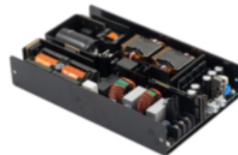
Medical / Industrial AC-DC Power Supply 600W Convection Cooling / MEU-600C

Per richiedere documentazione tecnica, disponibilità, campioni o ulteriori informazioni sui prodotti commercializzati, scrivete a info@consystem.it